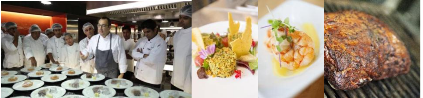
Art & Science in ドバイ

Art & Scienceとは、WACS（世界司厨士協会連盟）とエレクトロラックス・プロフェッショナル社とのパートナーシップ活動の一環で、世界各国のWACS加盟国にて行われている参加型調理セミナーの名称です。