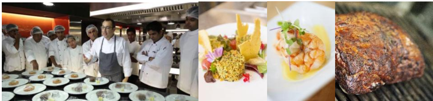
Art & Science in ドバイ